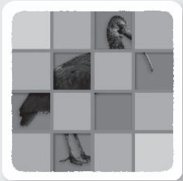
les cartes Mission