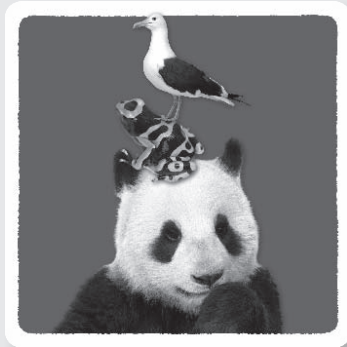
les cartes Mission Solo